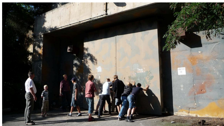
Der Reiz, die Tür zu öffnen war riesengroß.

Durch unsere Neugier getrieben, versuchten wir diesen zu öffnen. Auch mit aller Gewalt und nach etlichen Versuchen ließen wir schließlich enttäuscht ab. Nach dem wir zurück im Lager waren, und unseren Fluglehrern von unserem Fund und Misserfolg erzählt hatten, fuhren diese im Laufe des nächsten Tages los, um sich dem Problem zu widmen. Als sie zurück kamen, prahlten sie nur so von ihrem Erfolg.