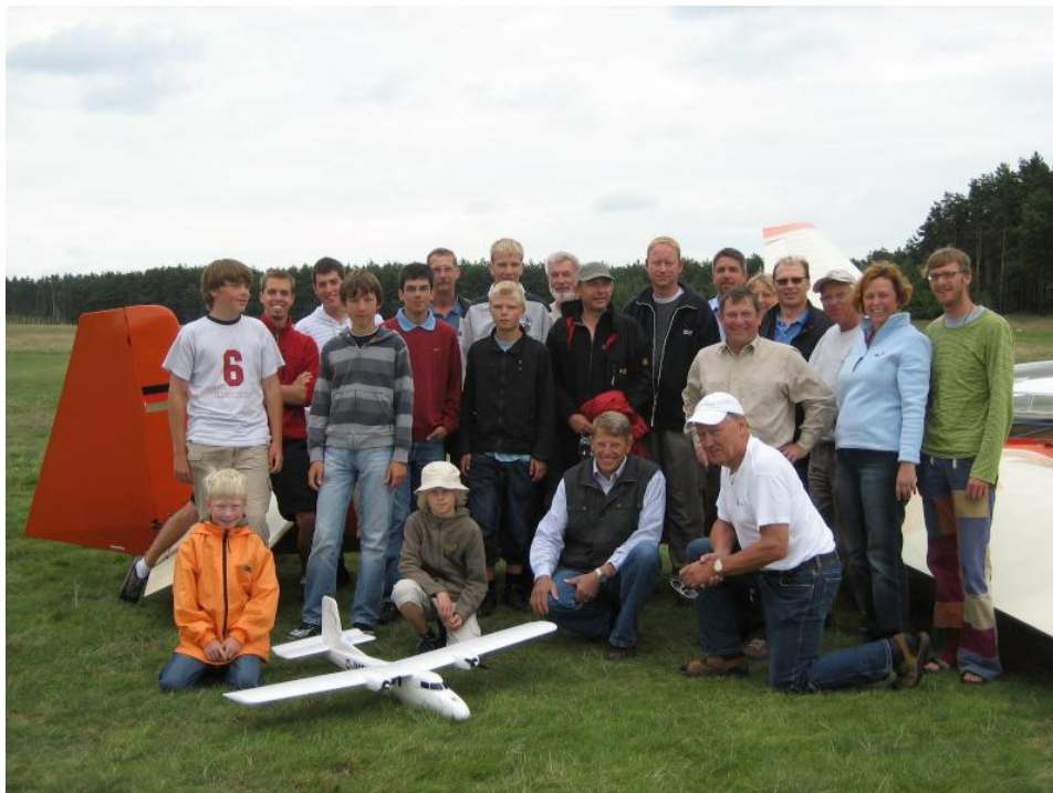
Die Teilnehmer 2. Woche

Die zweite Woche stand wettermäßig vergleichsweise unter einem recht guten Stern. So konnte Ullrich in seinem täglichen Wetterbriefing regelmäßig recht gute Möglichkeiten in Aussicht stellen. Je nach Können, Erfahrung und Intentionen wurden diese sehr unterschiedlich umgesetzt.