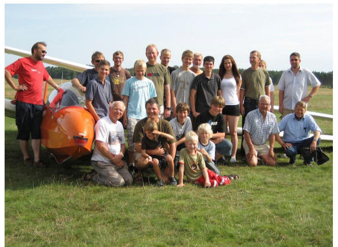
und Teilnehmer 1. Woche