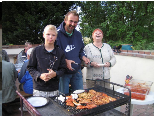
Grillmaster mit Assistenzen