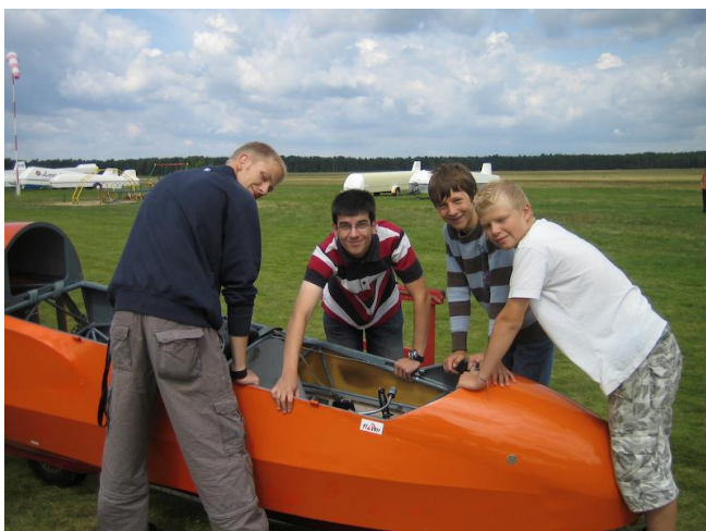
Aufrüsten der ASK 13